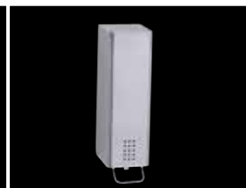
Seifenspender 1,4 L PU-140-LO