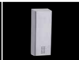
Elektr. Seifenspender PU-140E-LO