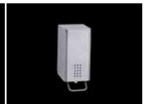
Seifenspender 0,5 L PU-141-LO